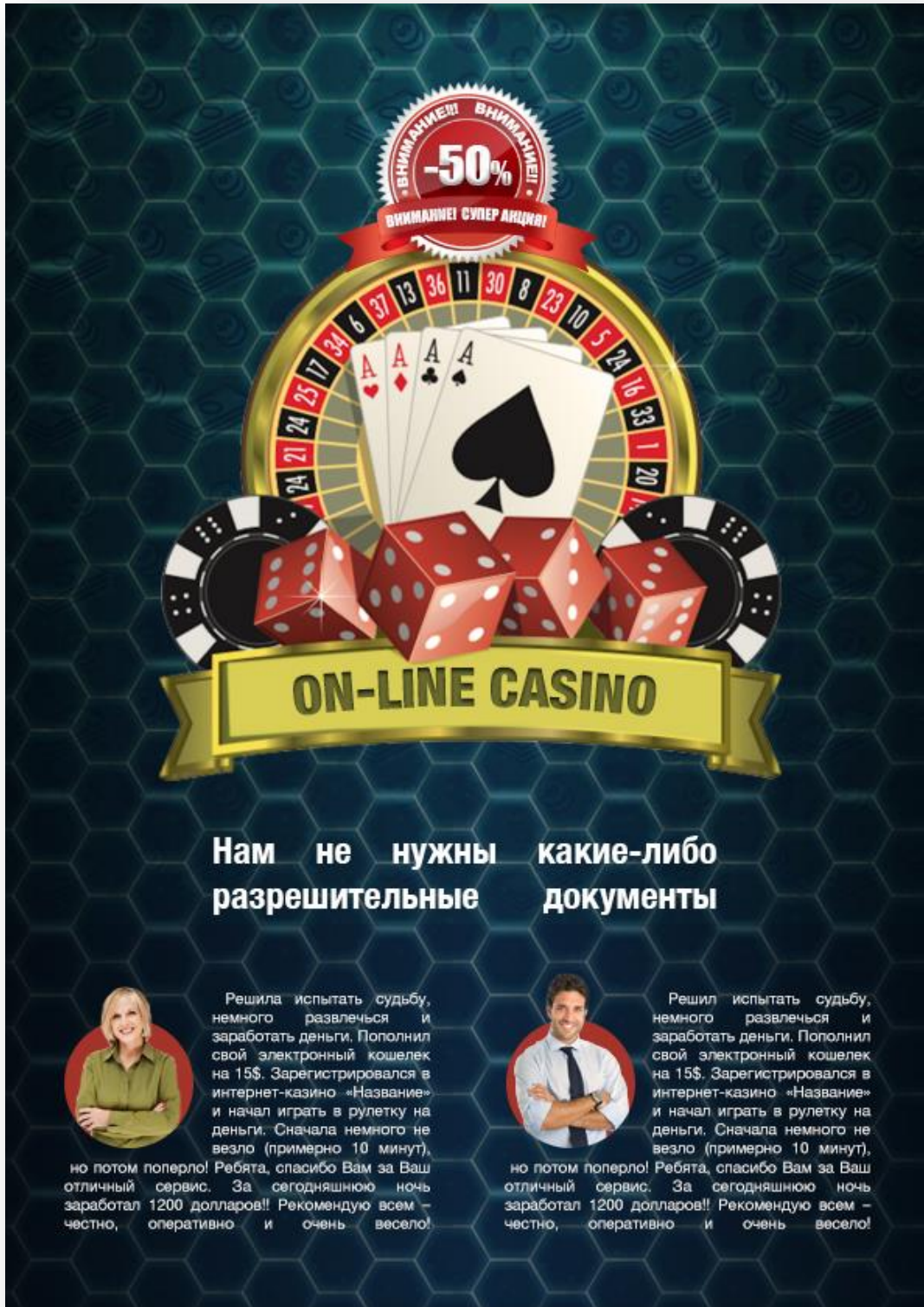
Пример черного лендинга