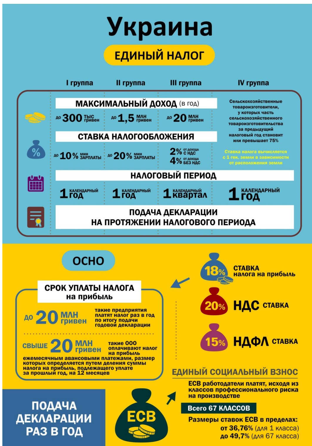
Таблица 1 - Типы налогообложения в Украине

Сильно зависит от поставленных задач в проекте. Если перечень услуг ограничивается одной-двумя, а ваши доходы скромны, достаточно статуса ИП на УСН 6% (либо аналога в Украине и Беларуси). Чем выше требования к конфиденциальности и чем выше доходность, тем больше причин оптимизировать налогообложение с применением сложных схем, созданием иностранных компаний в странах с лояльным налогообложением и т.п. Так же стоит обратить внимание на Ваши расходы и исходя из этого выбирать соответствующий вариант налогообложения.